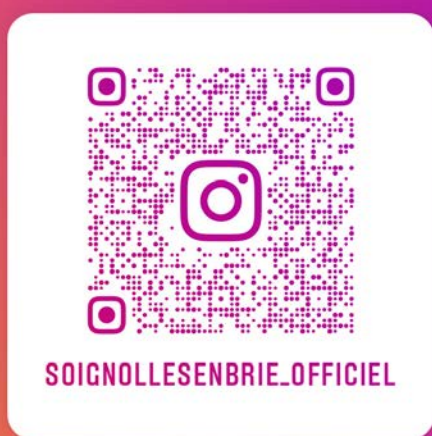
QR Code du compte Instagram