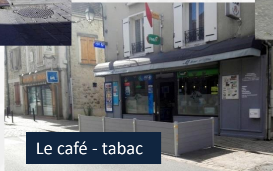
Le café - tabac