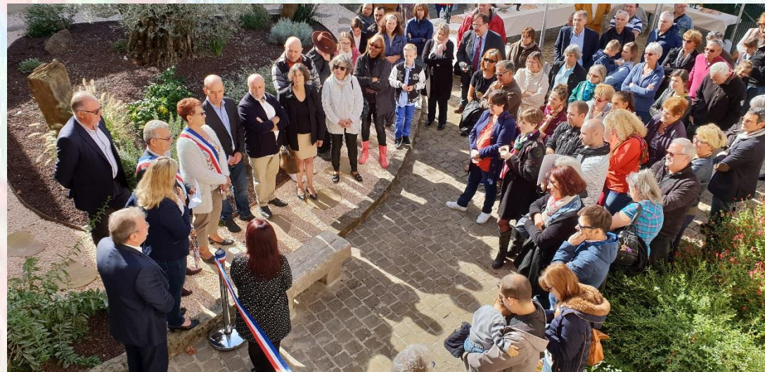
Inauguration de la Biblioposte le 29 septembre 2018