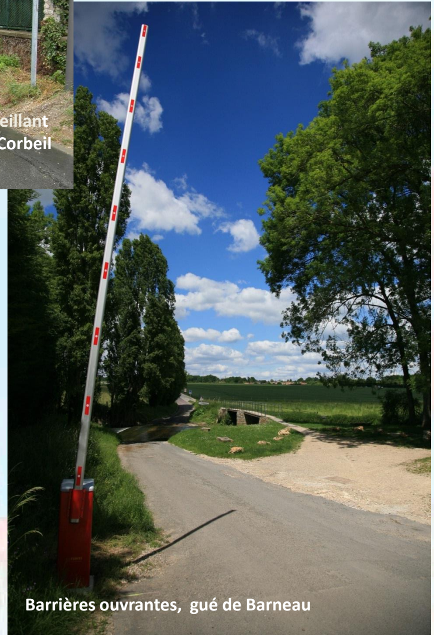
Barrières ouvrantes, gué de Barneau