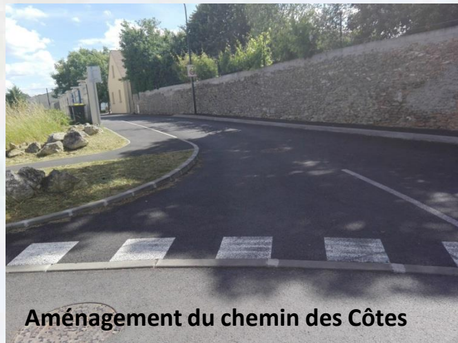
Aménagement du chemin des Côtes