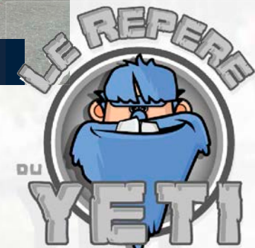
Les pizzas du lundi soir