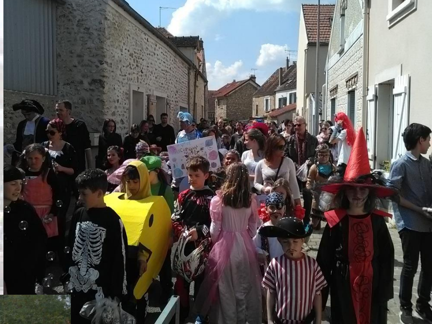
Le Carnaval de la FCPE