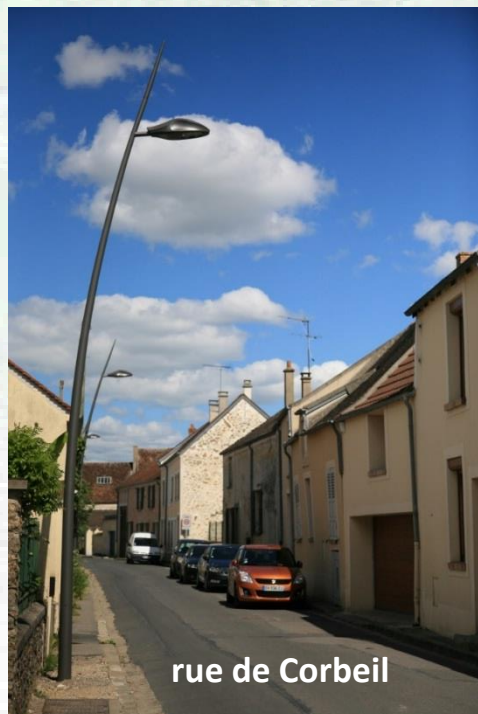
rue de Corbeil