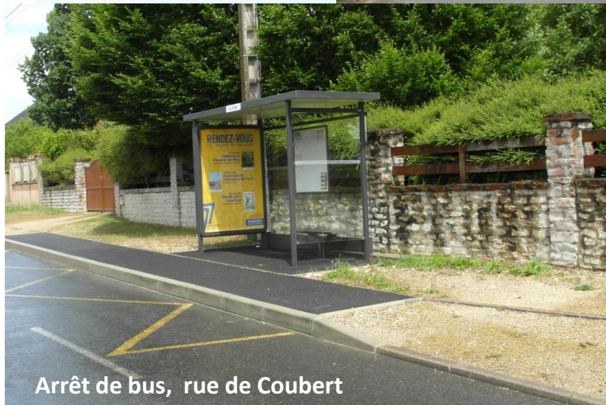
Arrêt de bus, rue de Coubert