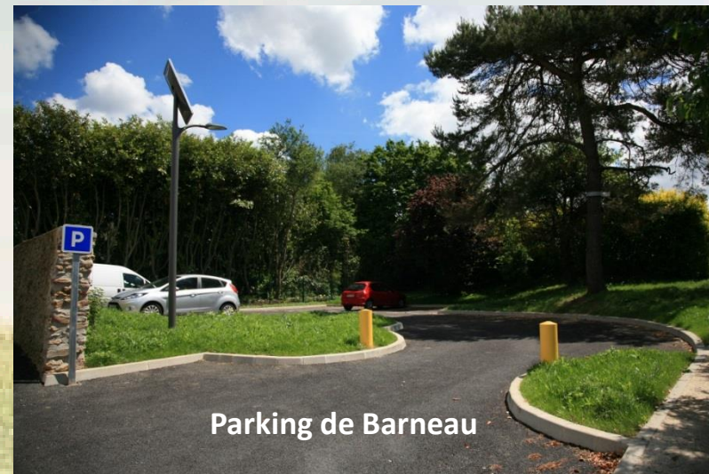
Parking de Barneau