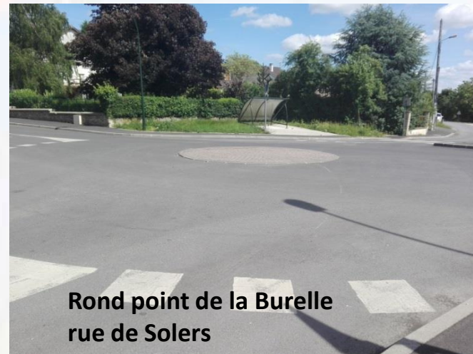
Rond point de la Burelle rue de Solers