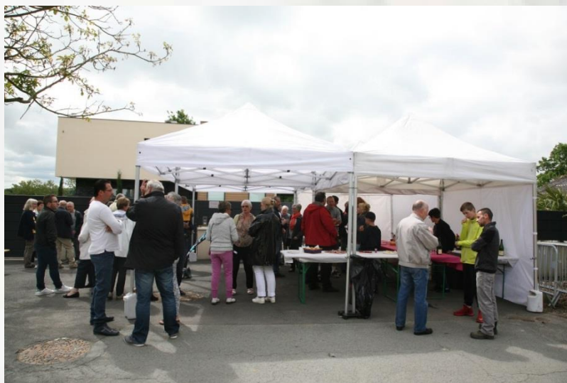
Quartier de la Planche