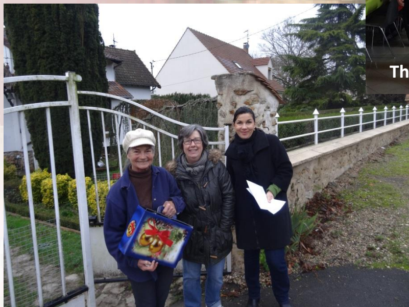
Distribution des colis du CCAS