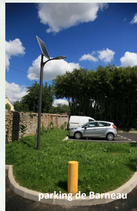
parking de Barneau