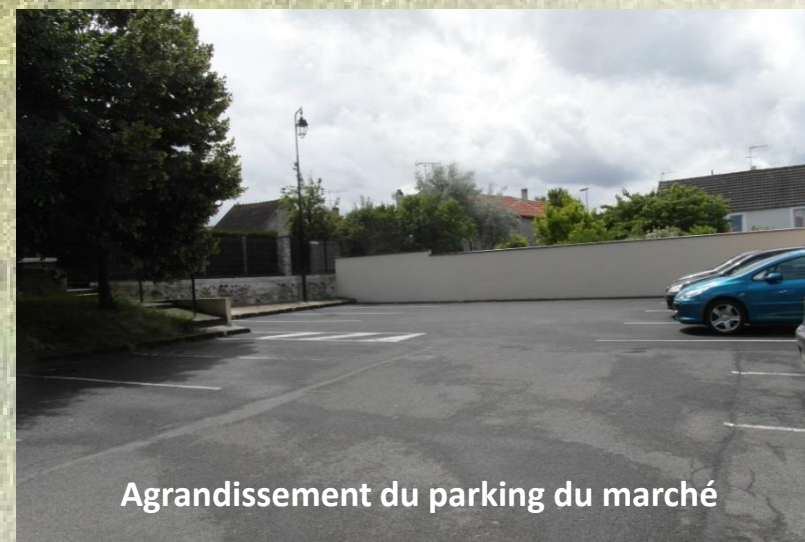
Agrandissement du parking du marché