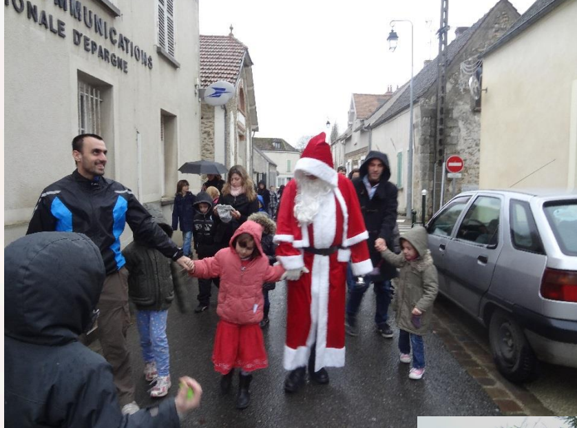
Le Père Noël à Soignolles