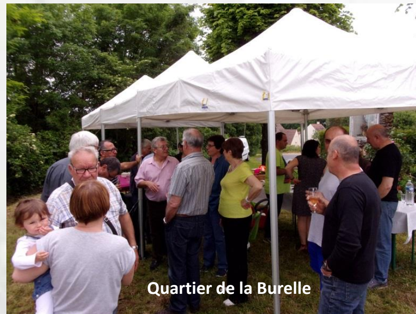
Quartier de la Burelle