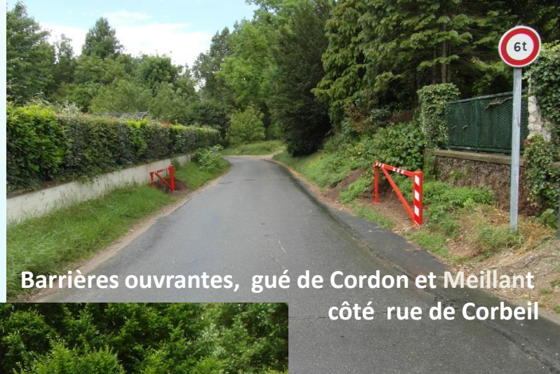
Barrières ouvrantes, gué de Cordon et Meillant côté rue de Corbeil