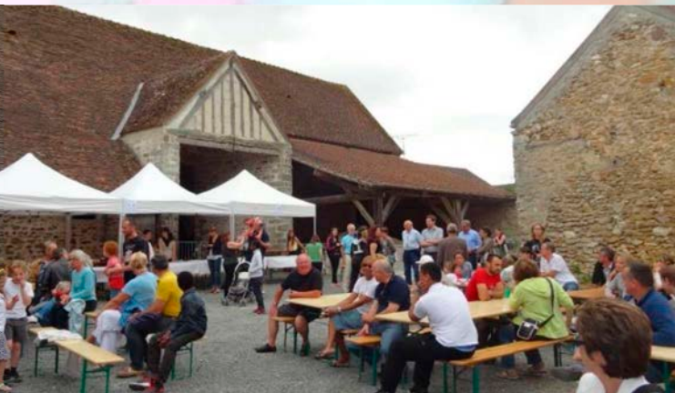
La Fête de la Musique