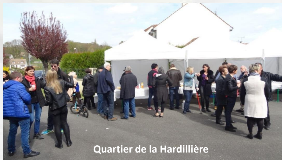
Quartier de la Hardillière