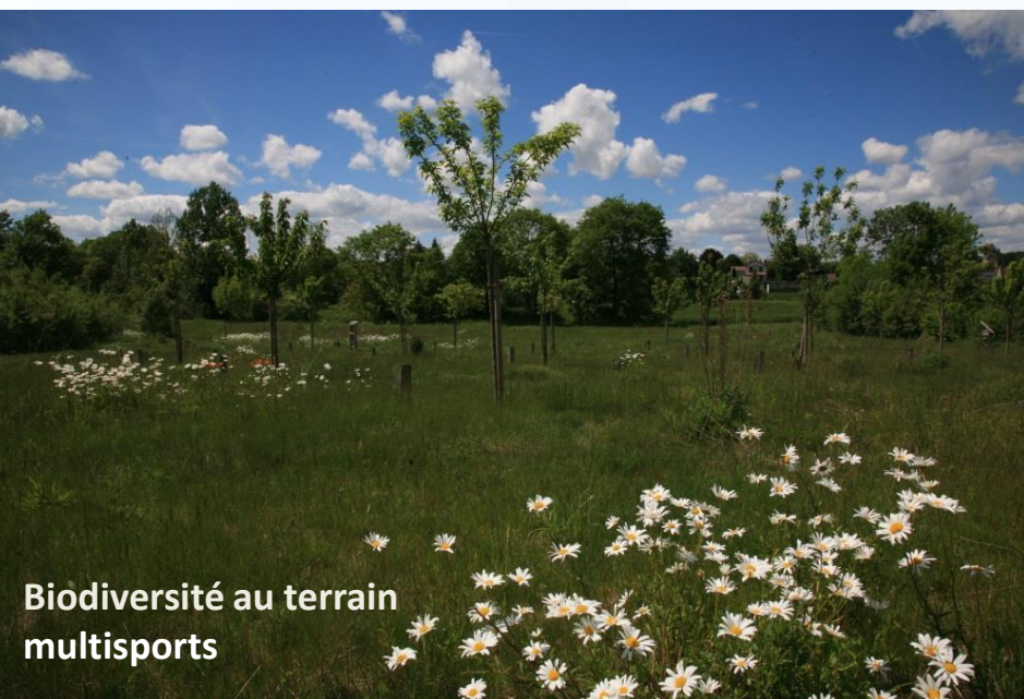
Biodiversité au terrain multisports