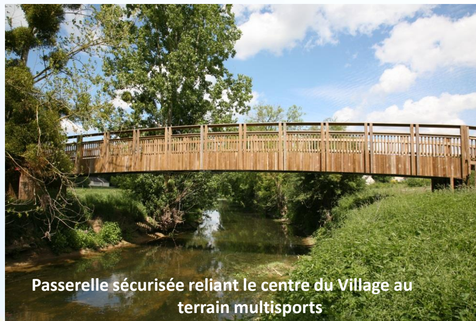
Passerelle sécurisée reliant le centre du Village au terrain multisports