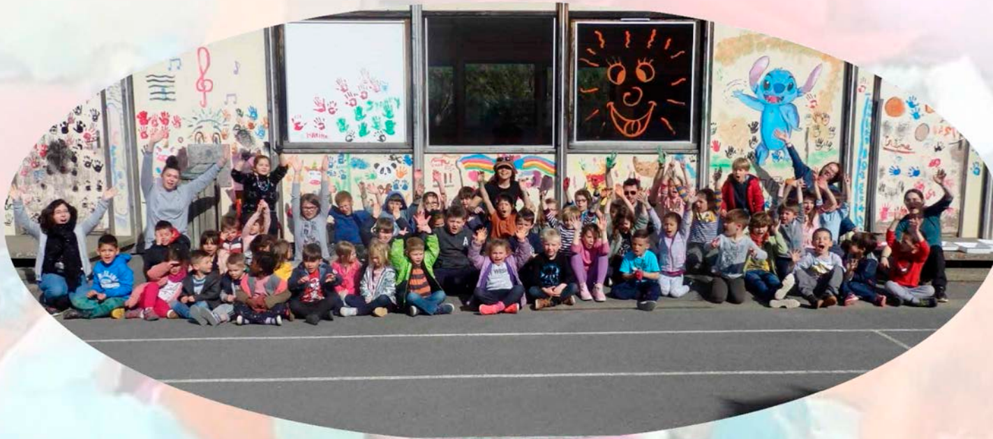
Street Art sur le préfabriqué