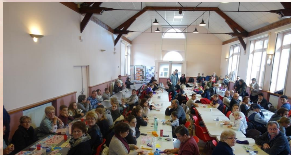
Loto du CCAS