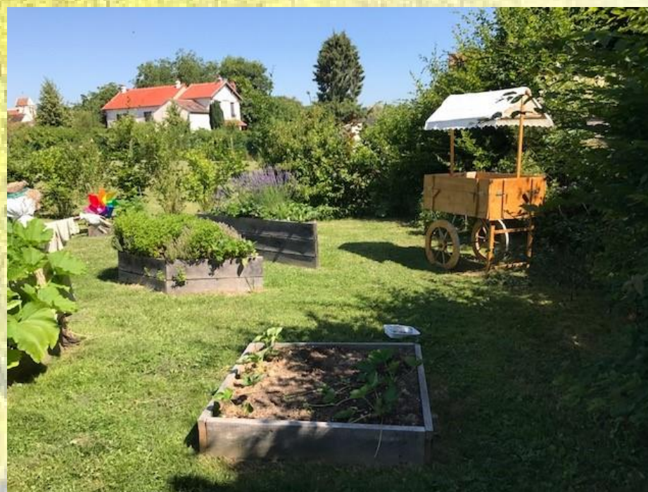
Potager des enfants du Centre de Loisirs