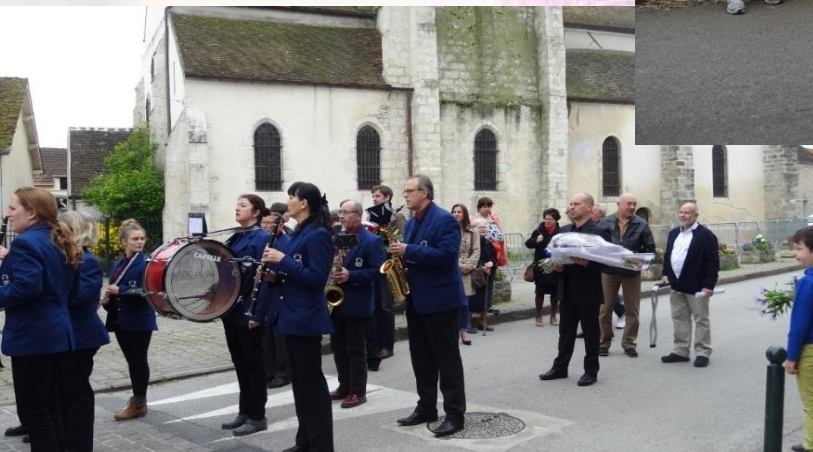
Les commémorations : 8 mai / 11 novembre