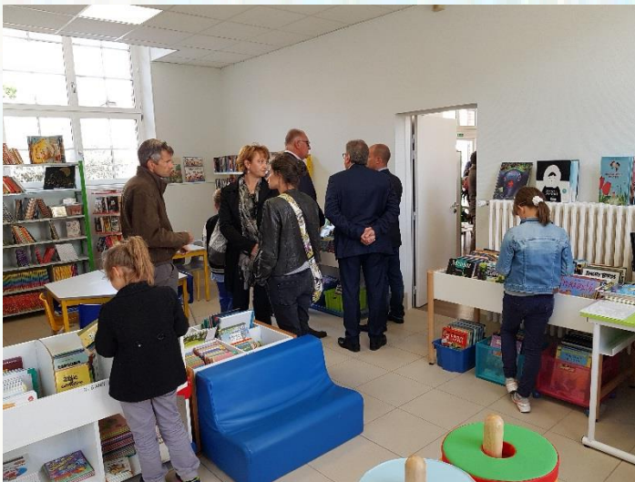
La nouvelle bibliothèque, plus spacieuse, plus lumineuse