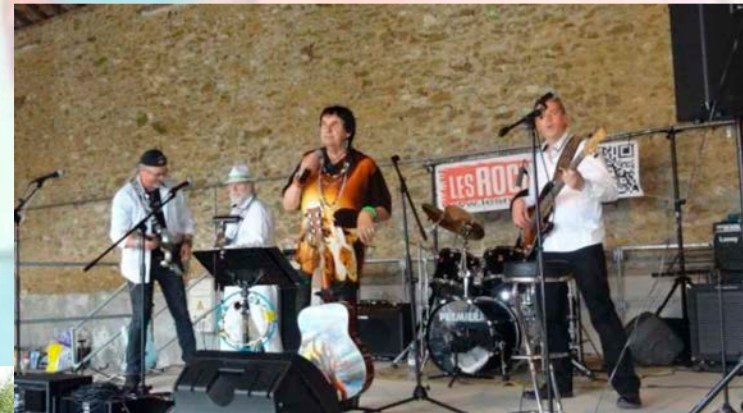
La Fête de la Musique