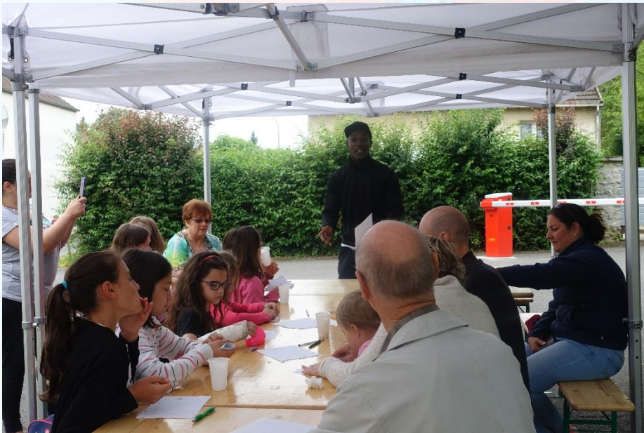
Café littéraire en plein air