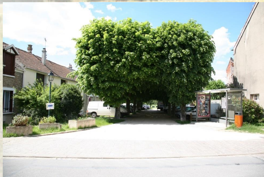
Réaménagement du parking, place Mathilde Vivot