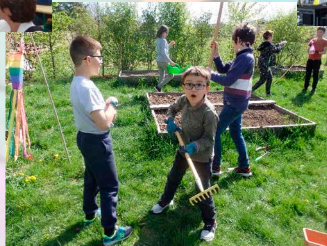
Le jardin des Petites Canailles