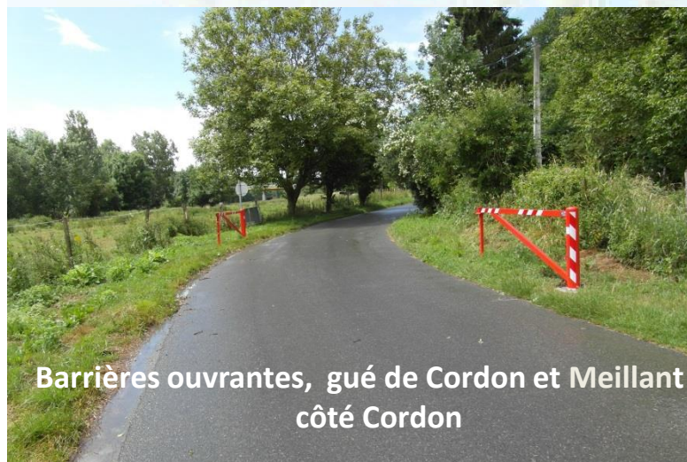
Barrières ouvrantes, gué de Cordon et Meillant côté Cordon