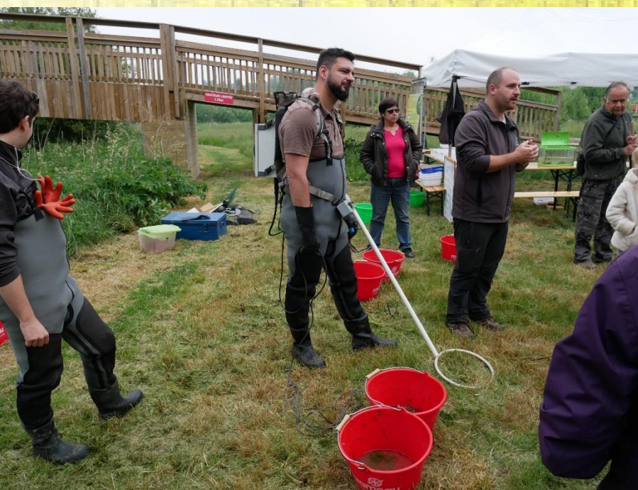
Fête de la Nature