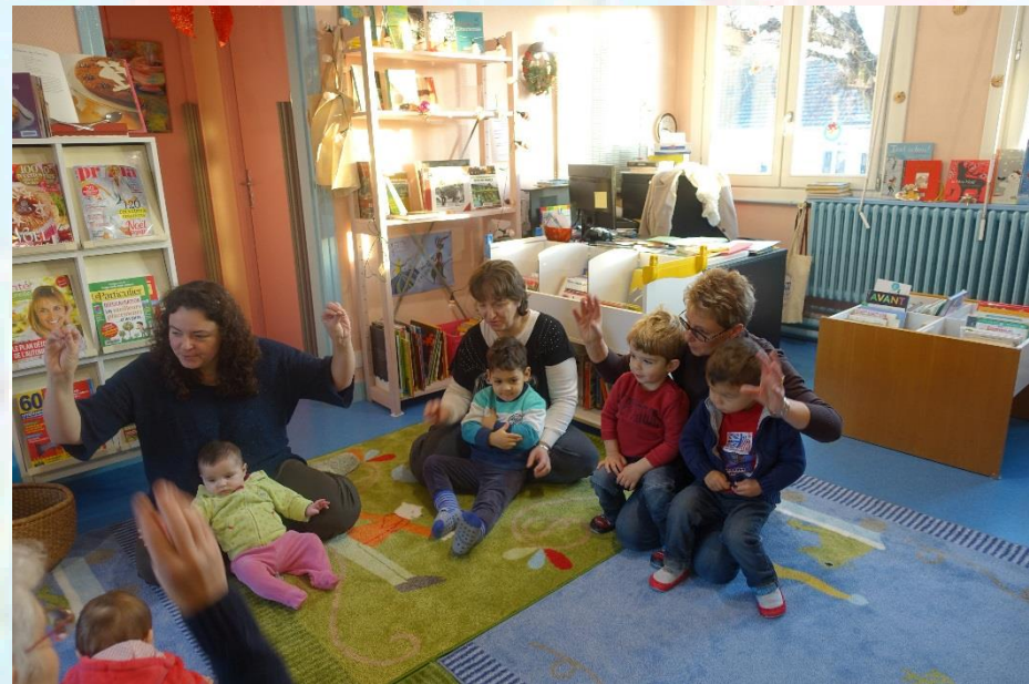
Les bébés lecteurs, et les bénévoles de la bibliothèque