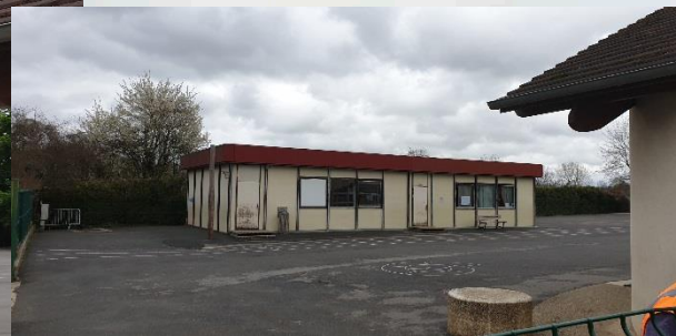
Démolition des préfabriqués de l'école (avant / après)