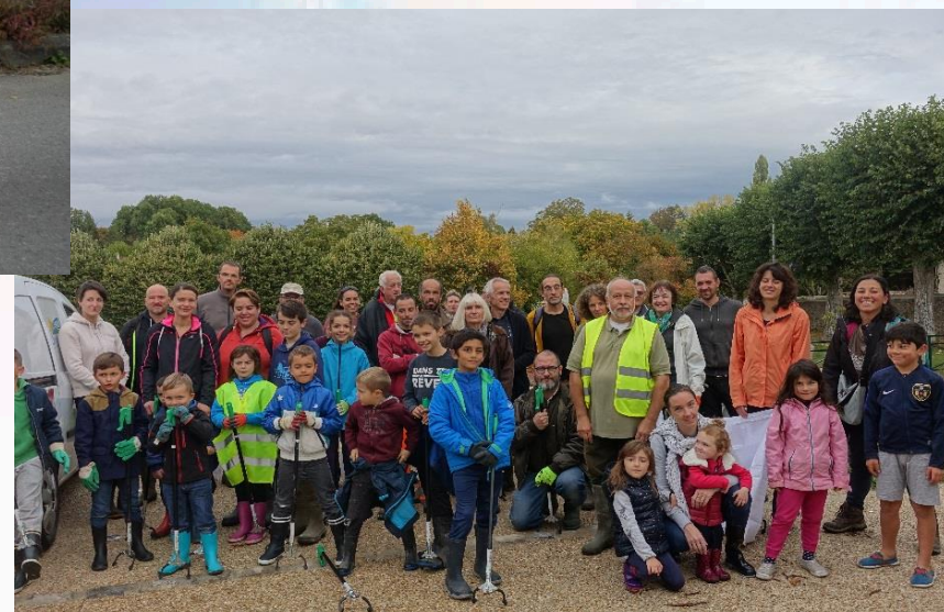
Le nettoyage des bords de l'Yerres