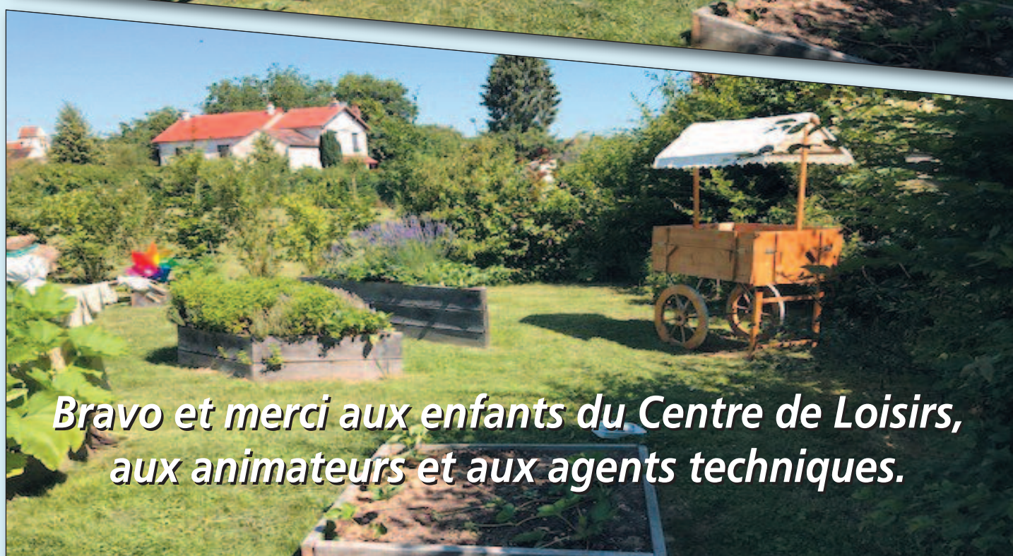
Bravo et merci aux enfants du Centre de Loisirs, aux animateurs et aux agents techniques.