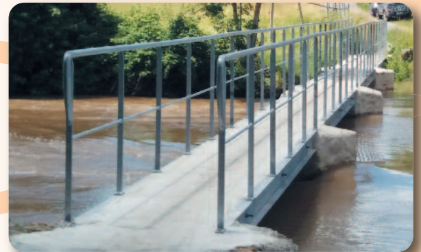
Installation d'un garde corps à Barneau et réfection du gué.