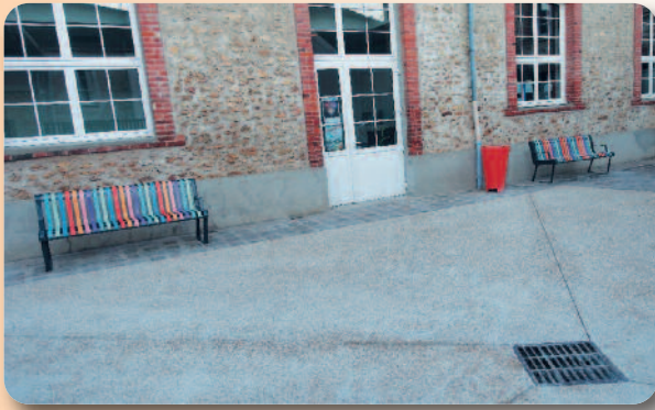
Réfection de la cour arrière de la mairie et remplacement des bancs vétustes.