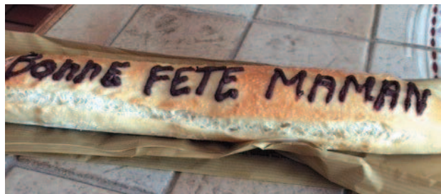
Boulangerie du village