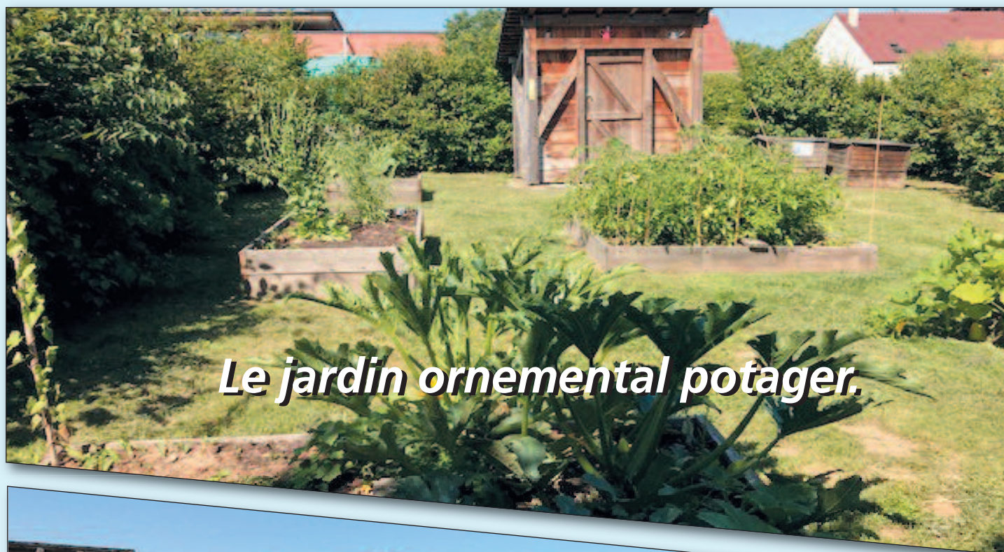
Le jardin ornemental potager.