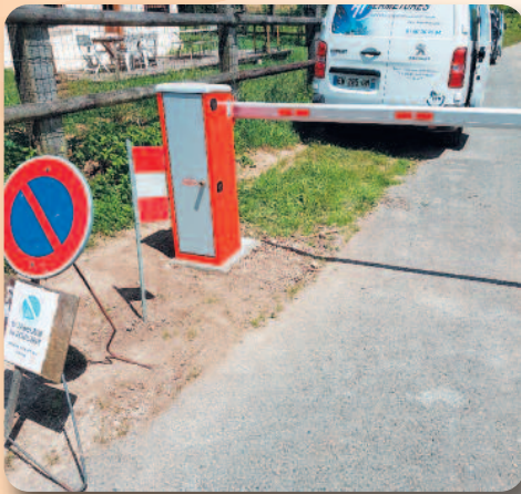
Mise en place de barrières de sécurité au gué de Mont.