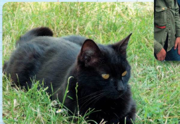
« Réglisse » la mascotte des enfants