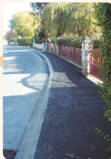
Reprise de trottoirs sur le haut de la rue de Cordon.