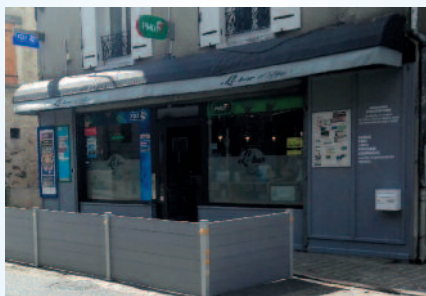
LE BAR D'HÉLÈNE