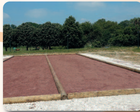
Réalisation de 2 terrains de pétanque et réhabilitation de la descente en pavés, place Mathilde Vivot.