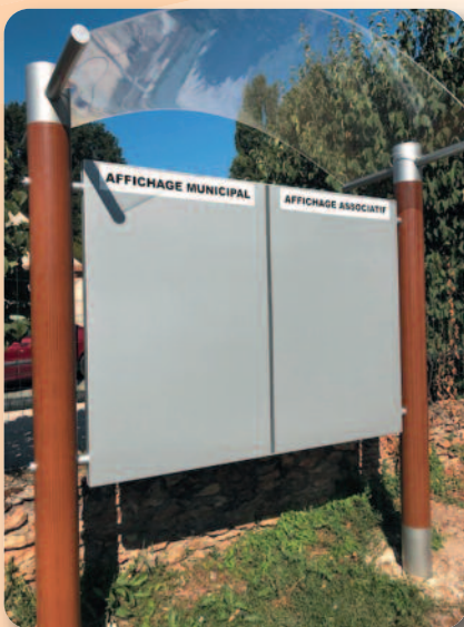
Remplacement des panneaux d'affichage.