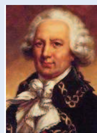
Pierre de Ronsard