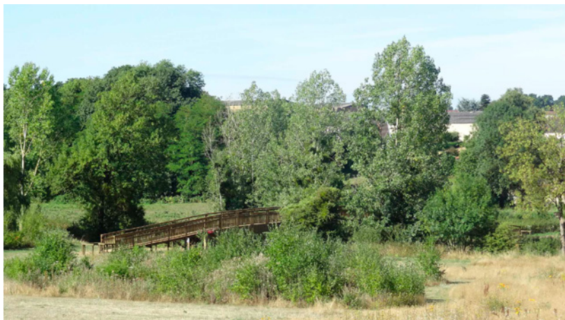
Passerelle de Soignolles

Mairie de Soignolles-en-Brie Rue de Corbeil - 77111 SOIGNOLLES-EN-BRIE Tel : 01.64.42.55.77 - Fax : 01.64.42.55.76 Site internet : www.ville-soignollesenbrie.fr