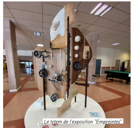
Le totem de l'exposition "Empreintes"