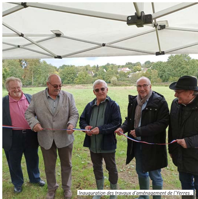
Inauguration des travaux d'aménagement de l'Yerres