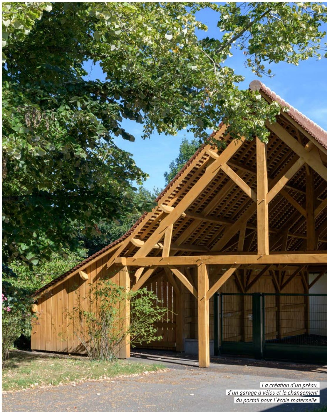
La création d'un préau, d'un garage à vélos et le changement du portail pour l'école maternelle.