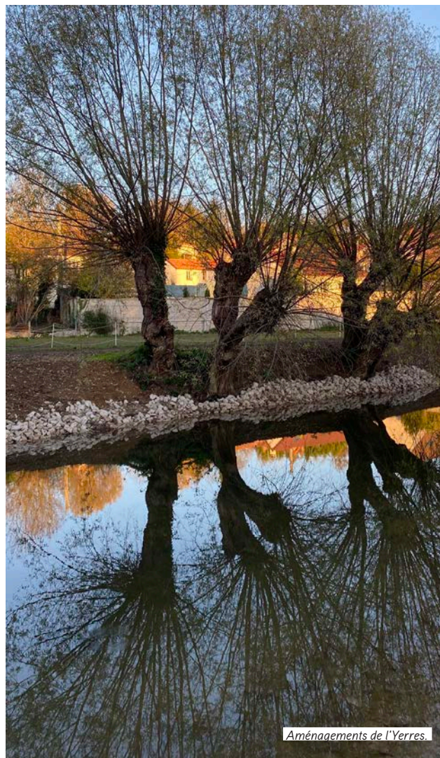
Aménagements de l'Yerres.

Le coût de la rénovation du parc des éclairages publics du hameau de Barneau s'élève à 41 231€ TTC. L'État, par l'intermédiaire de la préfecture de Seine-et-Marne va faire bénéficier à la commune des subventions du Fonds Vert à hauteur de 80% du montant HT, soit 27 487€.