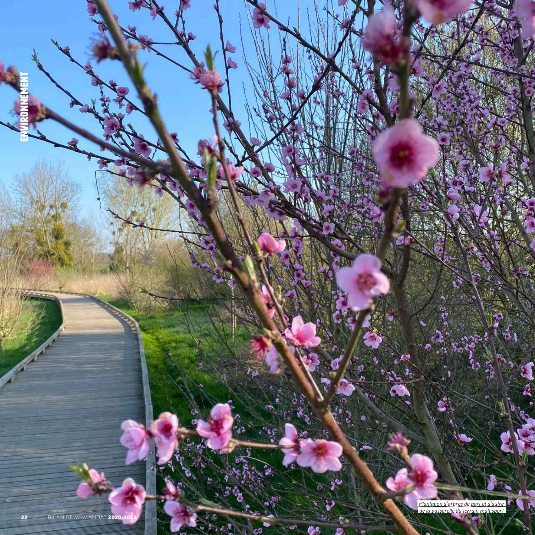
Plantation d'arbres de part et d'autre de la passerelle du terrain multisport