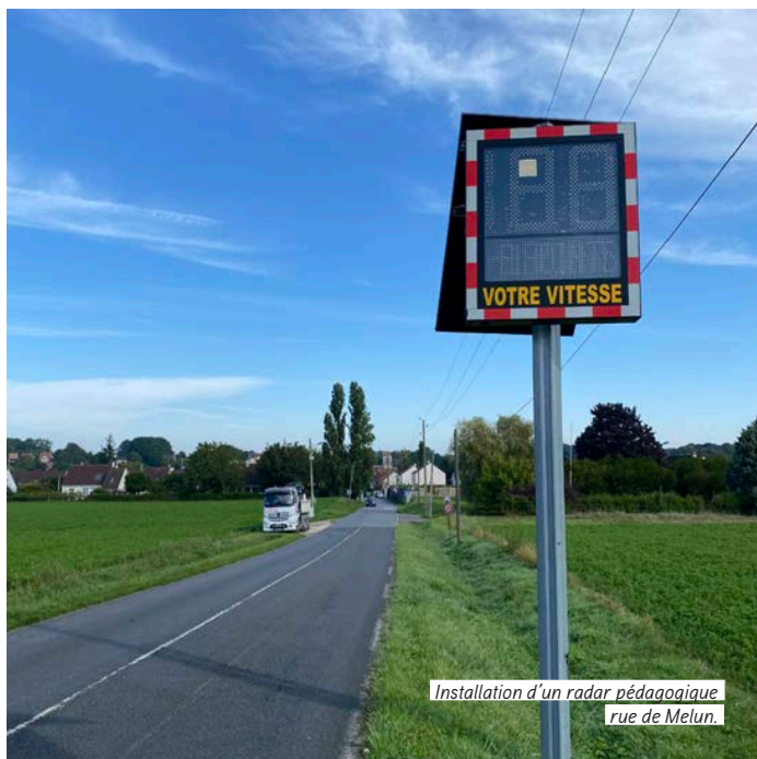
Installation d'un radar pédagogique rue de Melun.