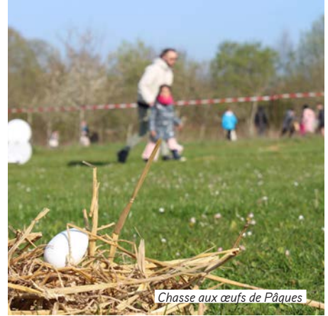
Chasse aux œufs de Pâques