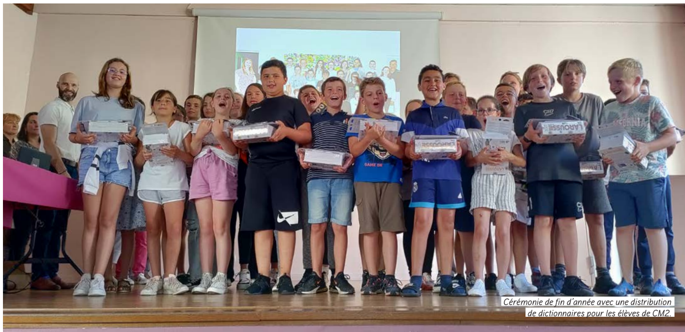
Cérémonie de fin d'année avec une distribution de dictionnaires pour les élèves de CM2.