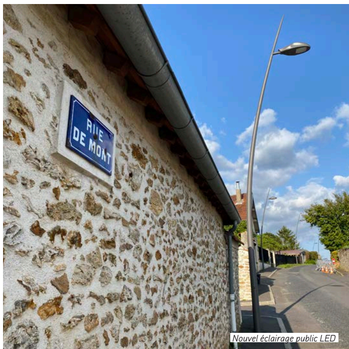
Nouvel éclairage public LED