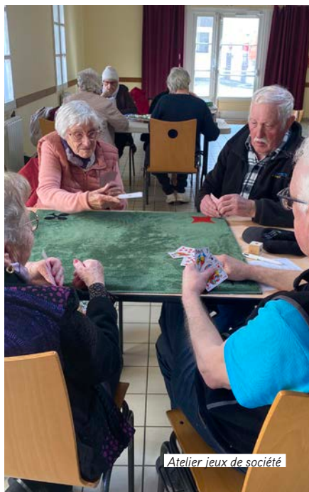
Atelier jeux de société