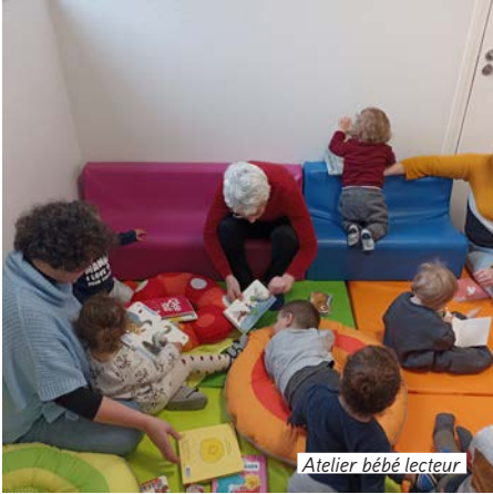
Atelier bébé lecteur