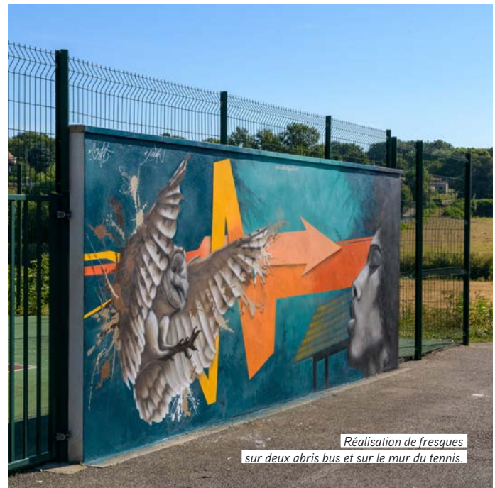
Réalisation de fresques sur deux abris bus et sur le mur du tennis.