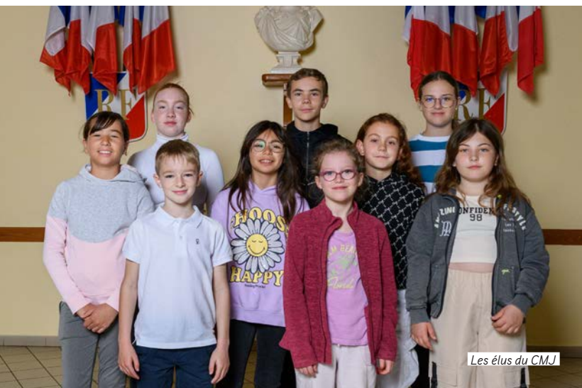
Les élus du CMJ

Le CMJ a été installé en novembre 2021. Depuis, les jeunes conseillers ont prouvé leur engagement et leur dynamisme.