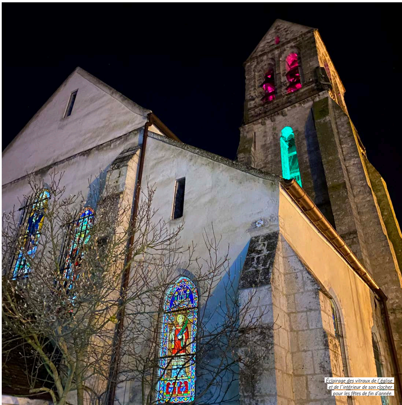
Éclairage des vitraux de l'église et de l'intérieur de son clocher pour les fêtes de fin d'année.