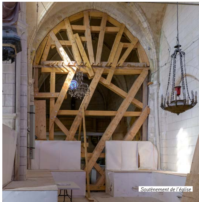
Soutènement de l'église

Les stalles et les statues restent sous protection dans l'église, attendant dans le silence la réouverture.