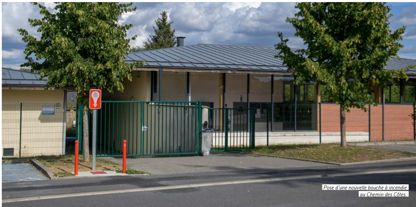
Pose d'une nouvelle bouche à incendie au Chemin des Côtes.