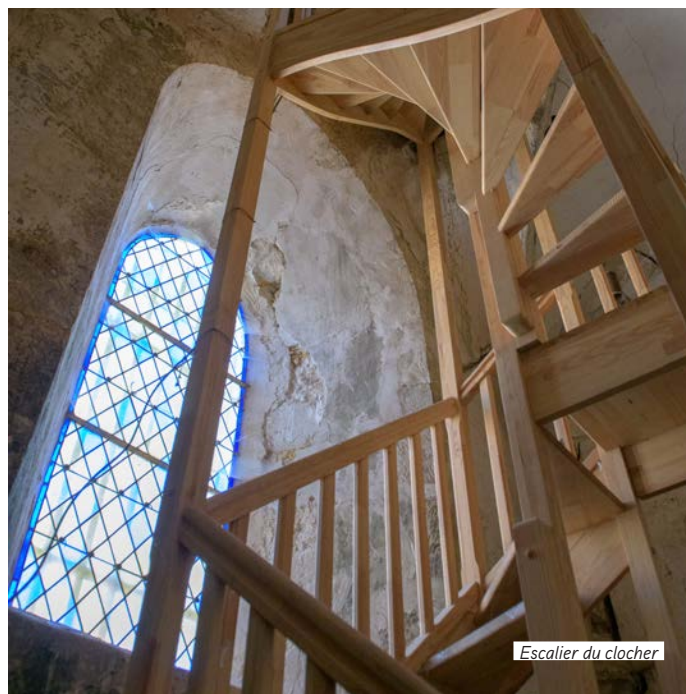
Escalier du clocher