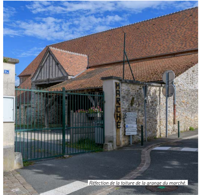
Réfection de la toiture de la grange du marché.