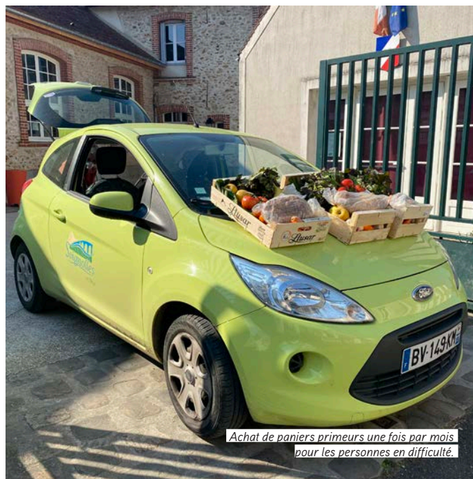
Achat de paniers primeurs une fois par mois pour les personnes en difficulté.