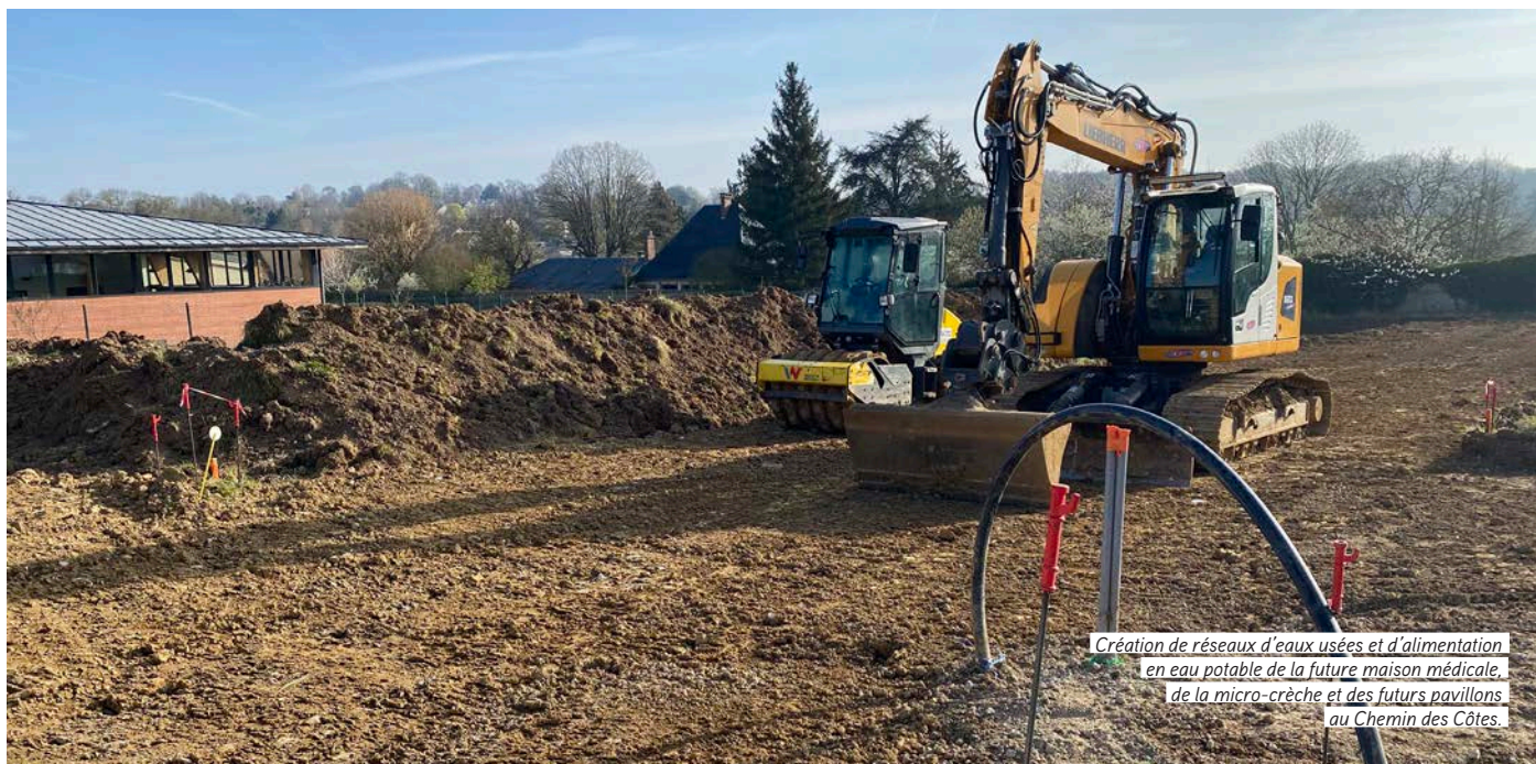
Création de réseaux d'eaux usées et d'alimentation en eau potable de la future maison médicale, de la micro-crèche et des futurs pavillons au Chemin des Côtes.