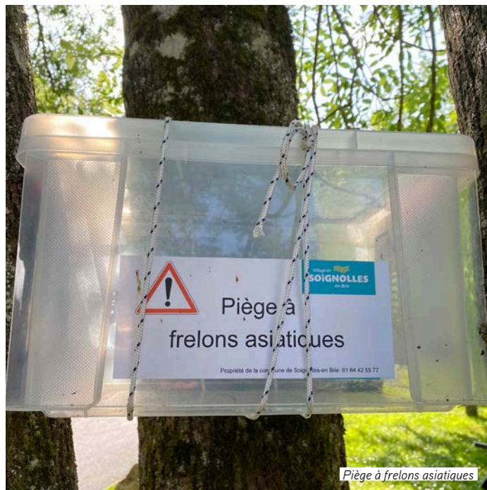
Piège à frelons asiatiques