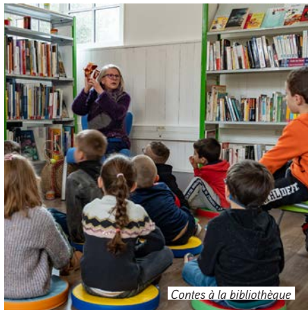
Contes à la bibliothèque