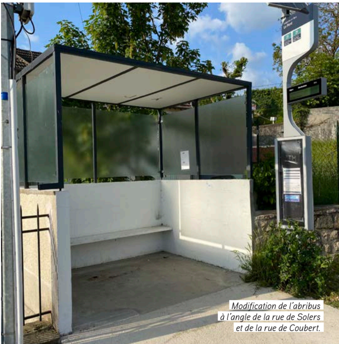
Modification de l'abribus à l'angle de la rue de Solers et de la rue de Coubert.