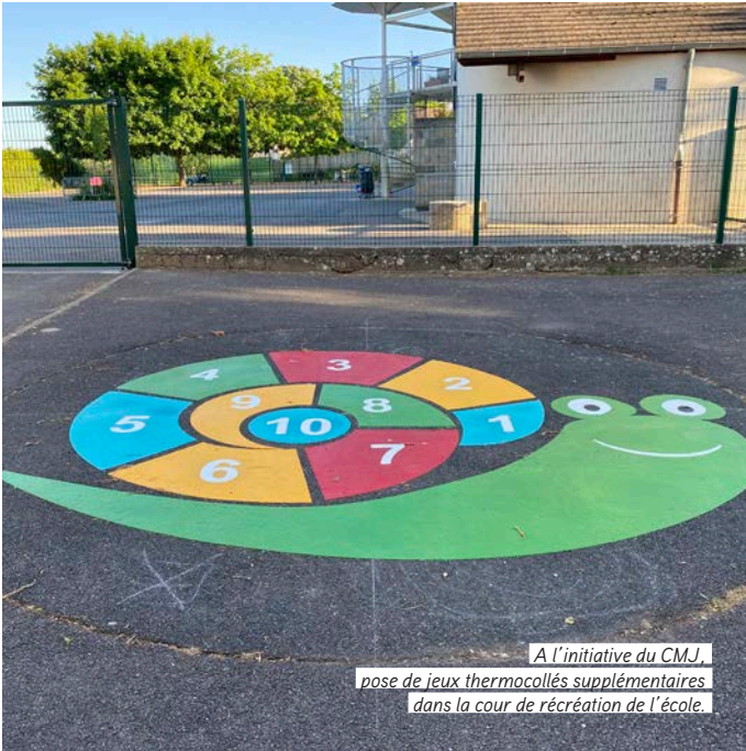
A l'initiative du CMJ, pose de jeux thermocollés supplémentaires dans la cour de récréation de l'école.