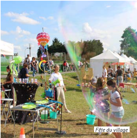
Fête du village