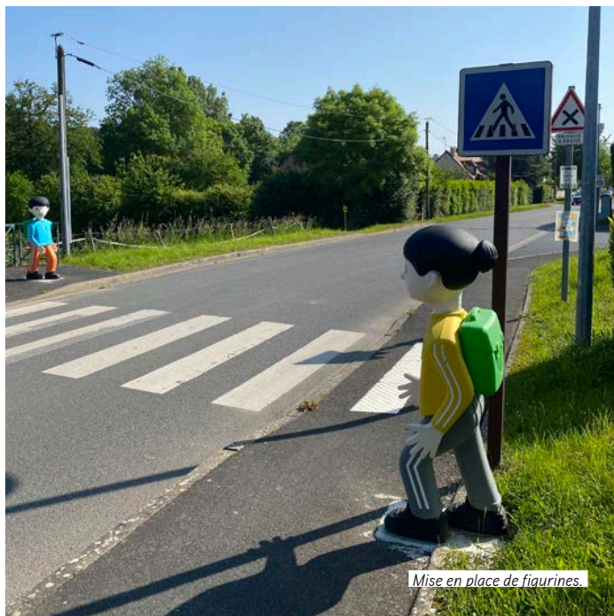
Mise en place de figurines.