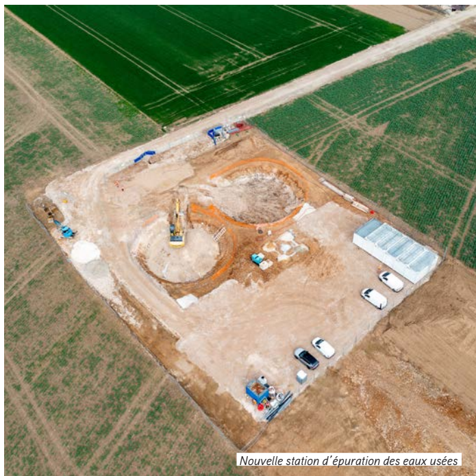
Nouvelle station d'épuration des eaux usées