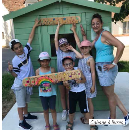
Cabane à livres