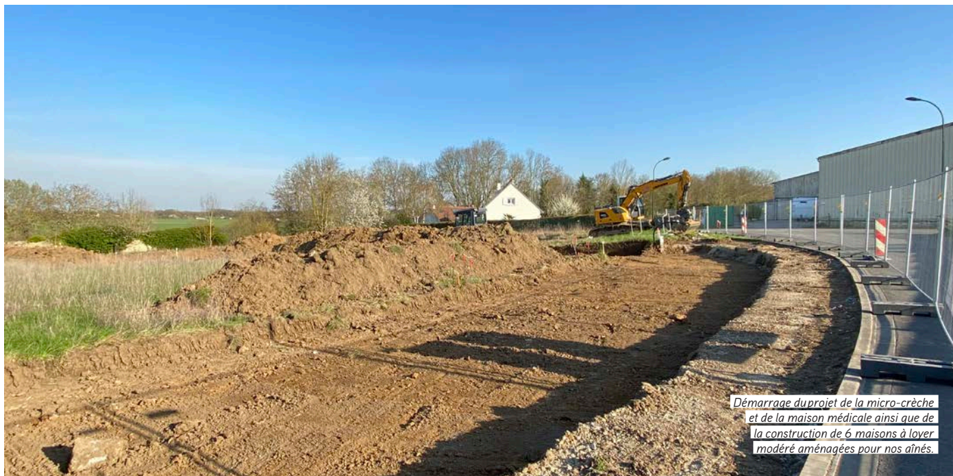
Démarrage du projet de la micro-crèche et de la maison médicale ainsi que de la construction de 6 maisons à loyer modéré aménagées pour nos aînés.