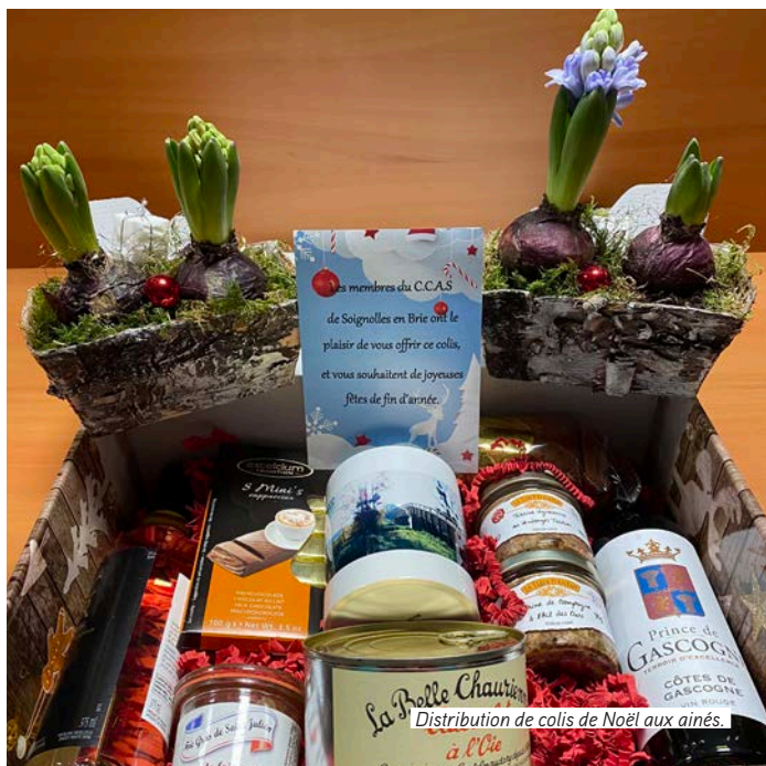
Distribution de colis de Noël aux aînés.