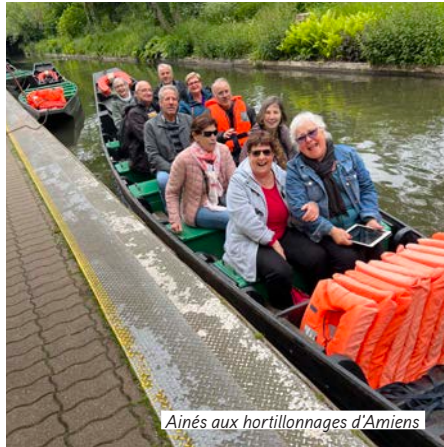
Aînés aux hortillonnages d'Amiens