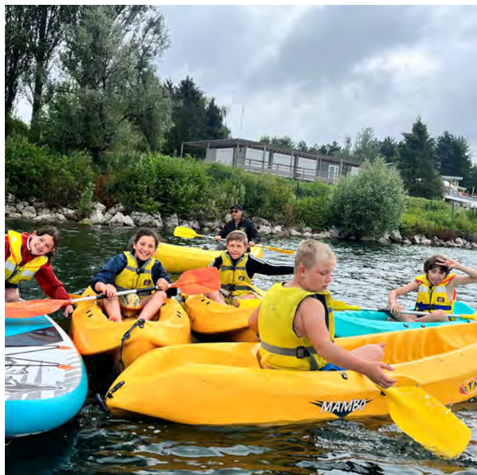
Deux mini-séjours de cinq jours subventionnés par la commune sont organisés chaque été pour les enfants de 7 à 11 ans.