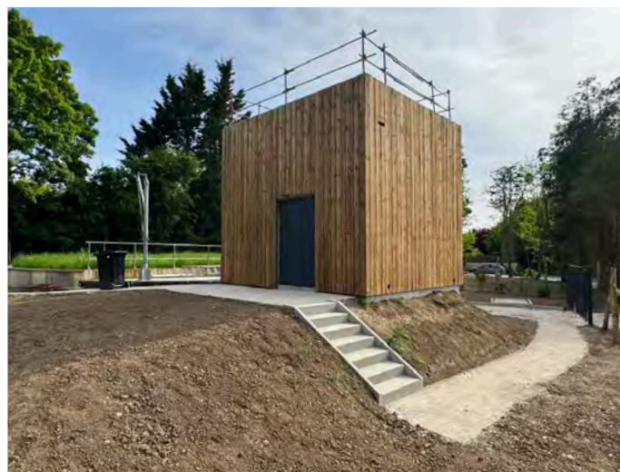
Deux réalisations de la CCBRC permettant de mieux protéger notre environnement et notre rivière : la station d'épuration à Cordon et le bassin d'orage dans le centre du village.