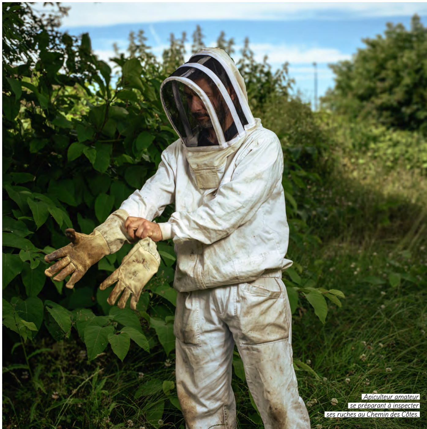
Apiculteur amateur se préparant à inspecter ses ruches au Chemin des Côtes.