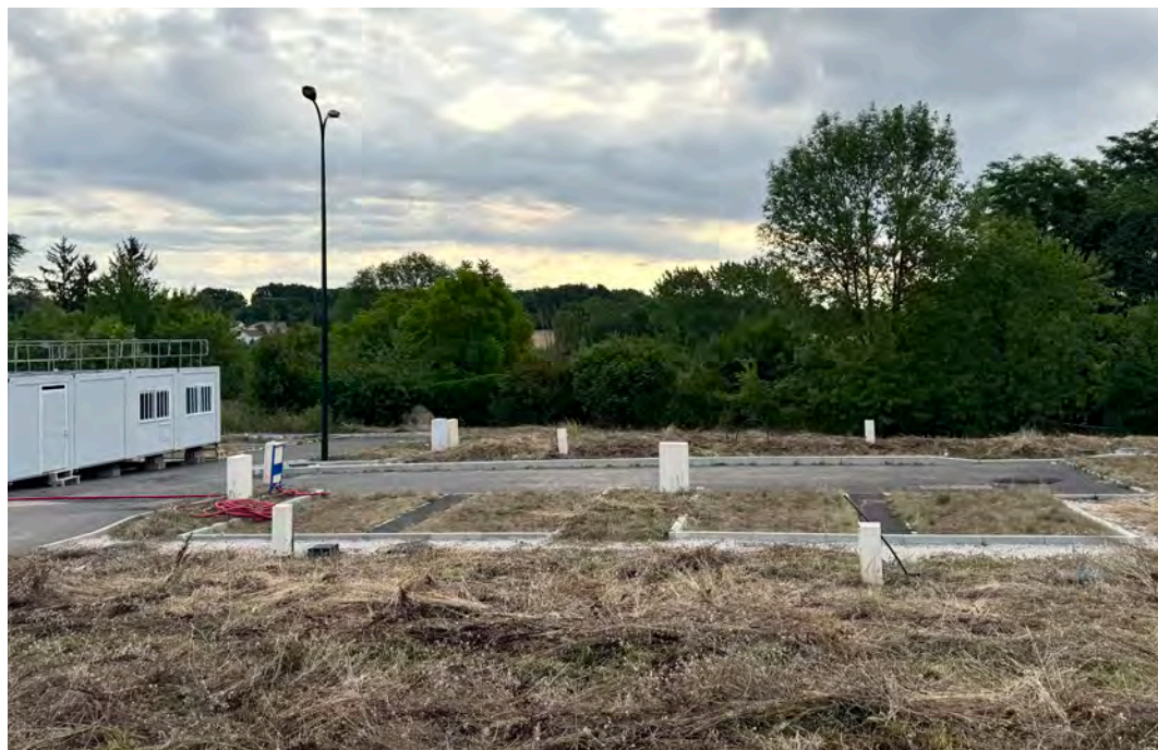
Construction de six maisons à loyers modérés aménagées pour nos aînés.