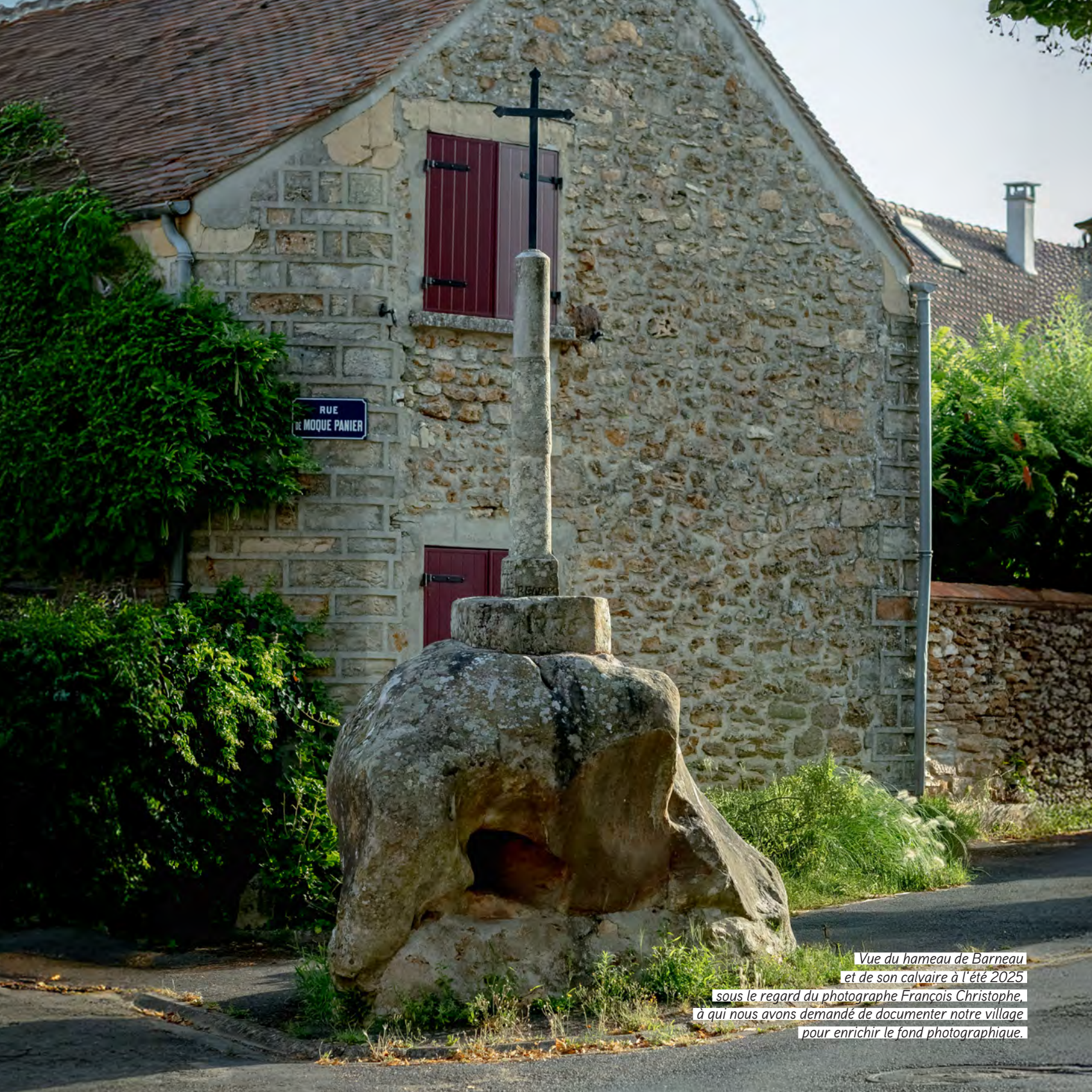
Vue du hameau de Barneau et de son calvaire à l'été 2025 sous le regard du photographe François Christophe, à qui nous avons demandé de documenter notre village pour enrichir le fond photographique.